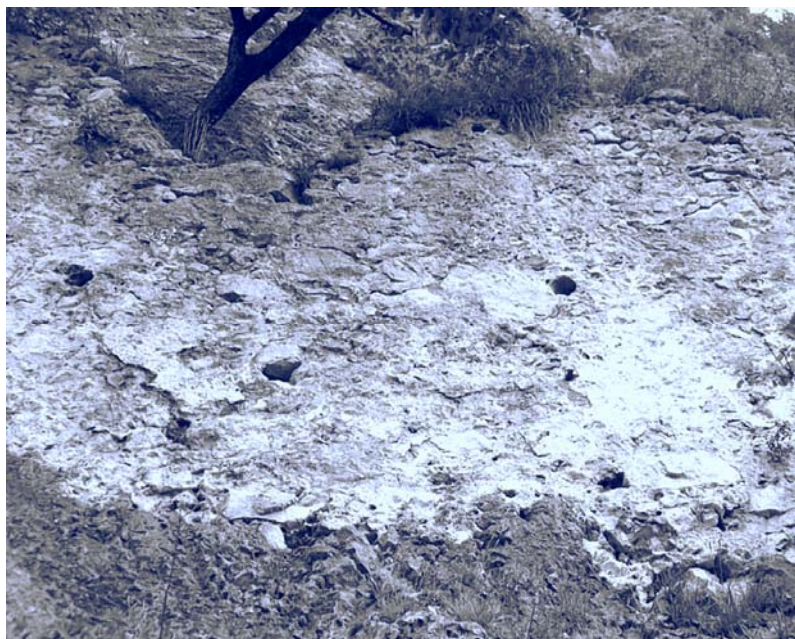
Jama pri Begunjah med gradom Kamen in Škratovim gradičem.

Odprtine na zidu Škratovega gradiča so služile kot line za odvodnjavanje.